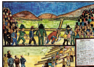
Simon von Cyrene hilft Jesus das Kreuz tragen (Kreuzweg in Cajamarca)

Ökumenisches Bildungswerk Kirchzarten-Oberried-Hofsgrund