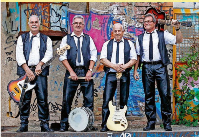
„The Liverpool Beats“ spielen am Samstagabend

Auf Euren Besuch freuen sich die Motorradfreunde Zastler e.V. www.mf-zastler.de