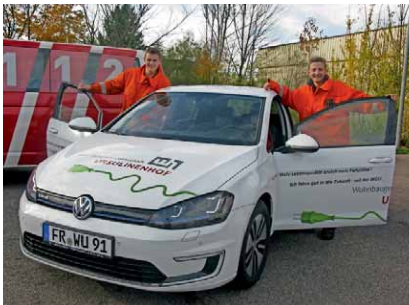
Die Freiwillige Feuerwehr Oberried hat in den vergangenen Wochen ebenfalls den E-Golf der Genossenschaft bei Fahrten von Lehrgängen u.Ä. genutzt.